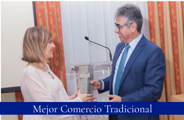
Mejor Comercio Tradicional