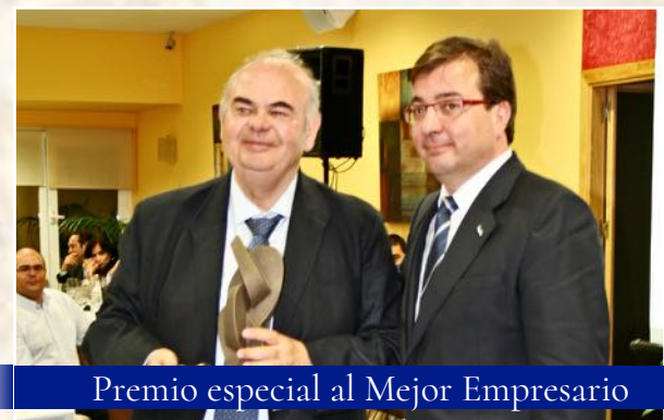
Premio especial al Mejor Empresario