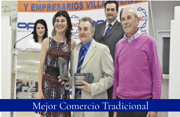
Mejor Comercio Tradicional