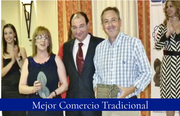
Mejor Comercio Tradicional