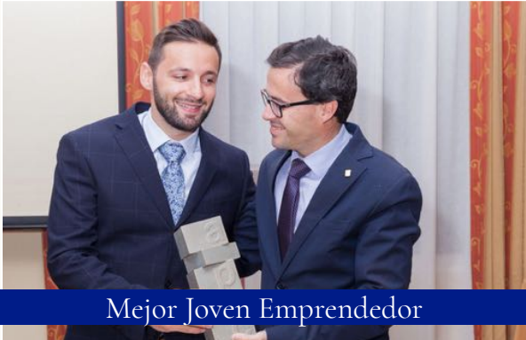
Mejor Joven Emprendedor