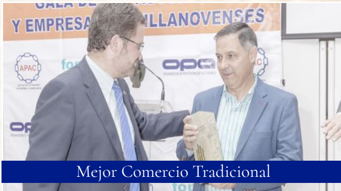
Mejor Comercio Tradicional