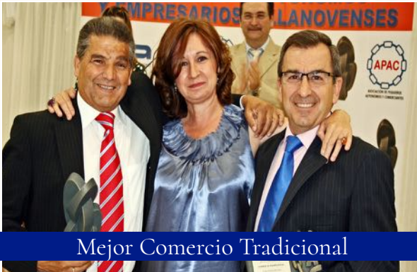
Mejor Comercio Tradicional