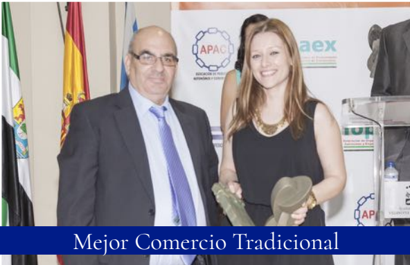
Mejor Comercio Tradicional