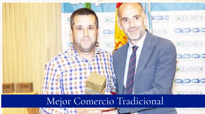
Mejor Comercio Tradicional