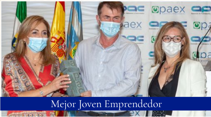
Mejor Joven Emprendedor