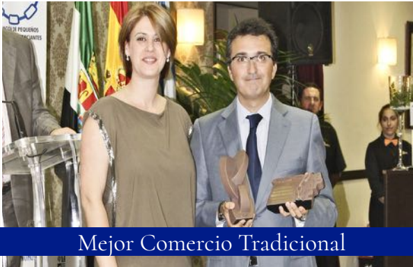
Mejor Comercio Tradicional