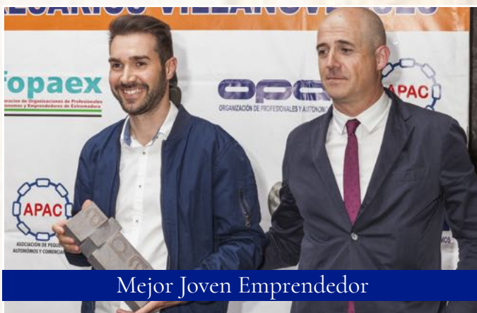
Mejor Joven Emprendedor