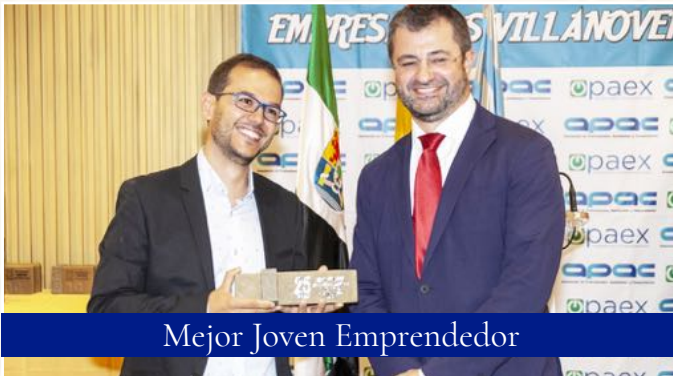
Mejor Joven Emprendedor