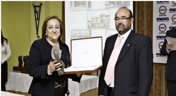
Mejor Comercio Tradicional