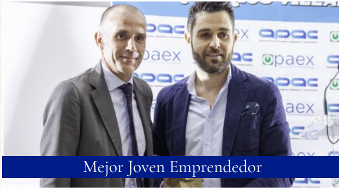
Mejor Joven Emprendedor