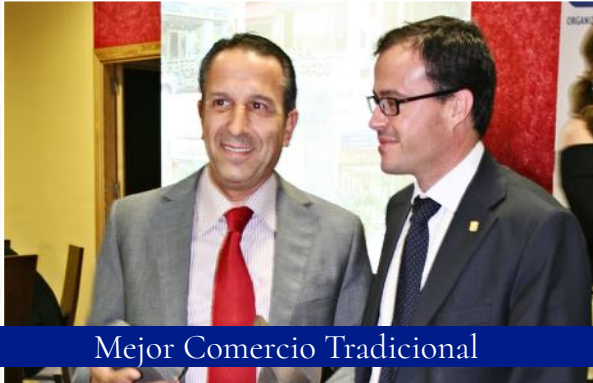
Mejor Comercio Tradicional