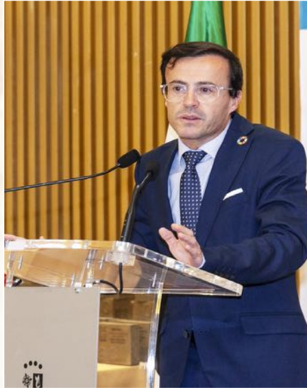
D. Miguel Ángel Gallardo Miranda (Alcalde de Villanueva de la Serena y presidente de la Diputación de Badajoz)