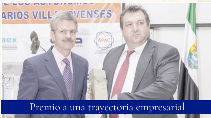
Premio a una trayectoria empresarial