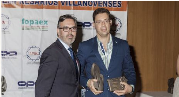
Mejor Comercio Tradicional